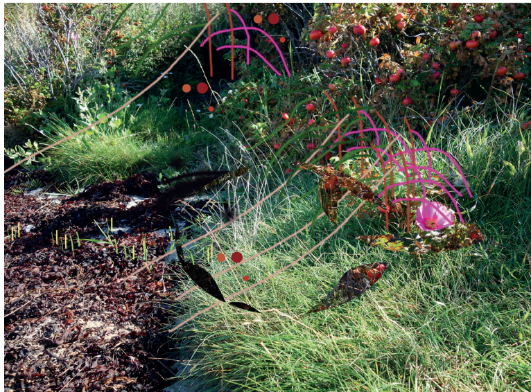
Algue herbe arbre églantine...fourmis Composition et peinture numérique, tirage photographique 2022