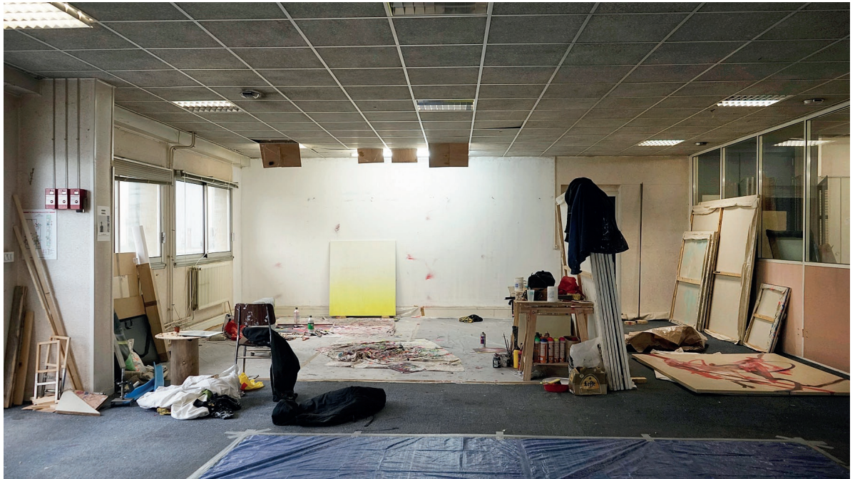
vue d'atelier, 2018